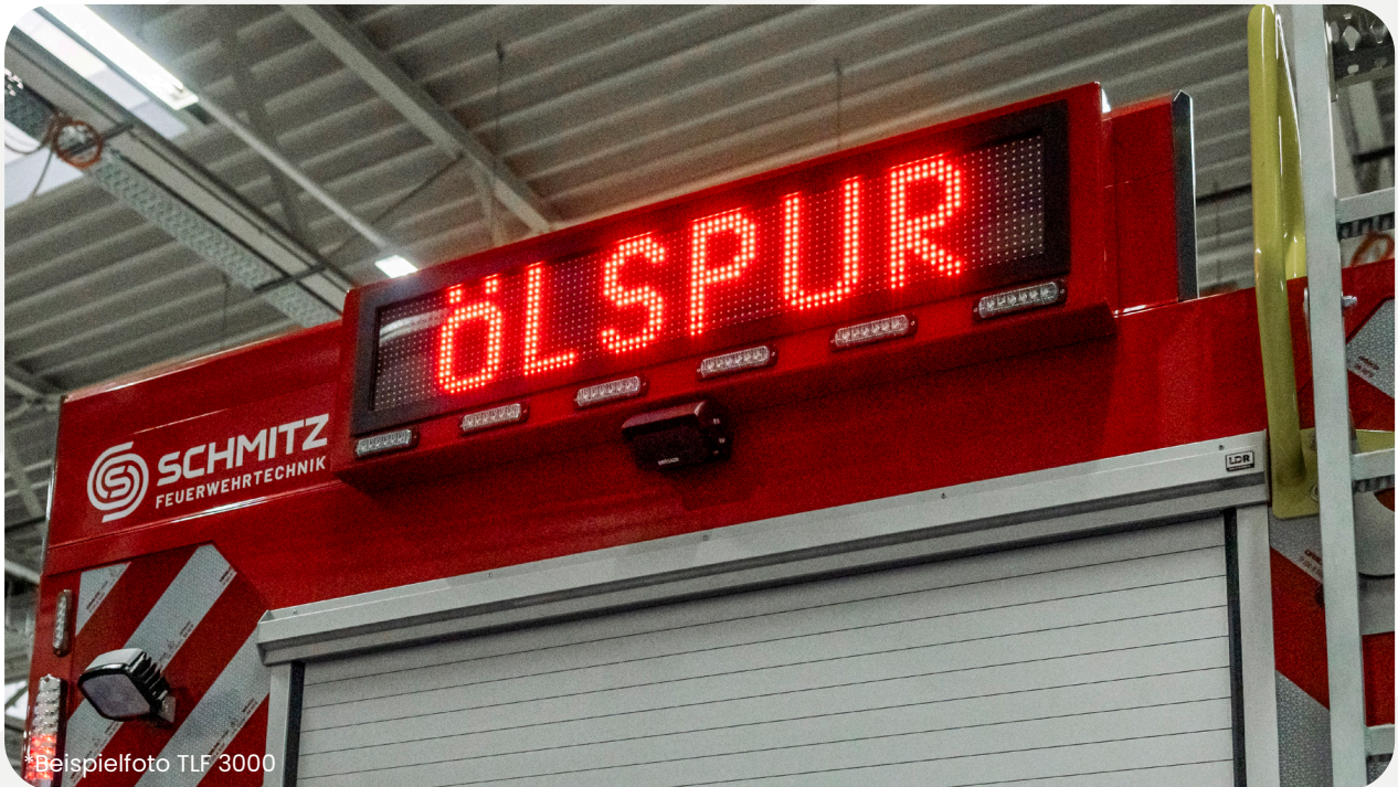
*Beispielfoto TLF 3000

Zusätzlich zur Sondersignalanlage kann am Heck eine Heckabsicherung verbaut werden.