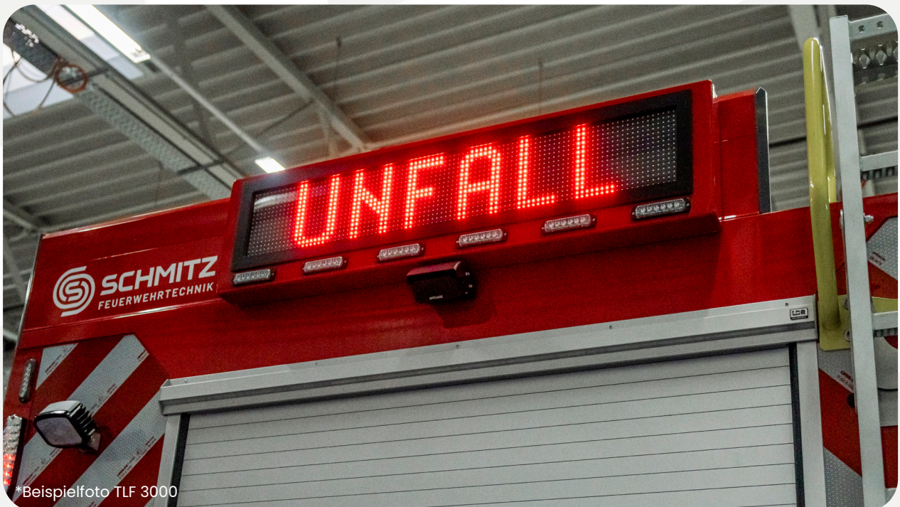
*Beispielfoto TLF 3000